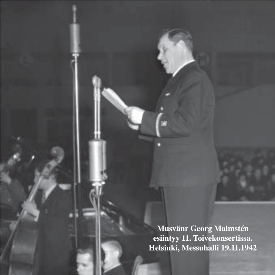
Musvännr Georg Malmstén esiintyy 11. Toivekonsertissa. Helsinki, Messuhalli 19.11.1942