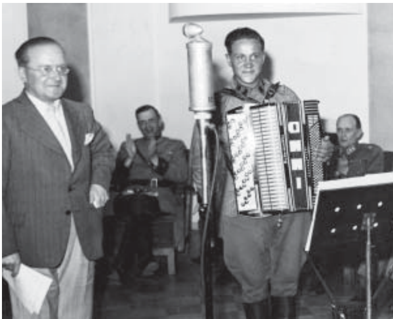
Propaganda-Aseveliliiton illanvietto: Matti Jurva ja Onni Laihanen. Helsinki 20.7.1941